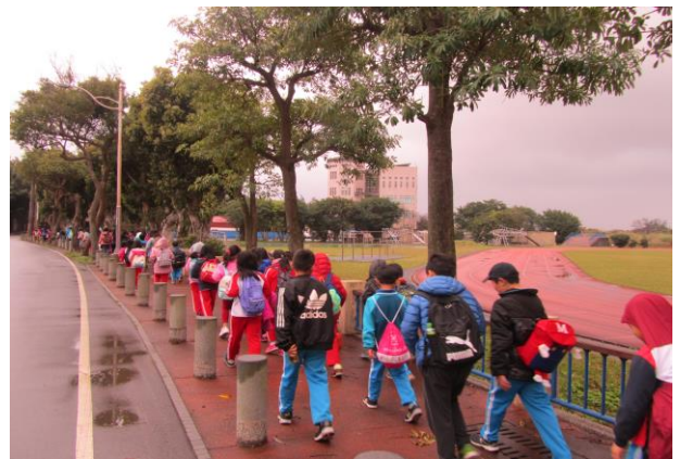
說明：設置學生通行步道