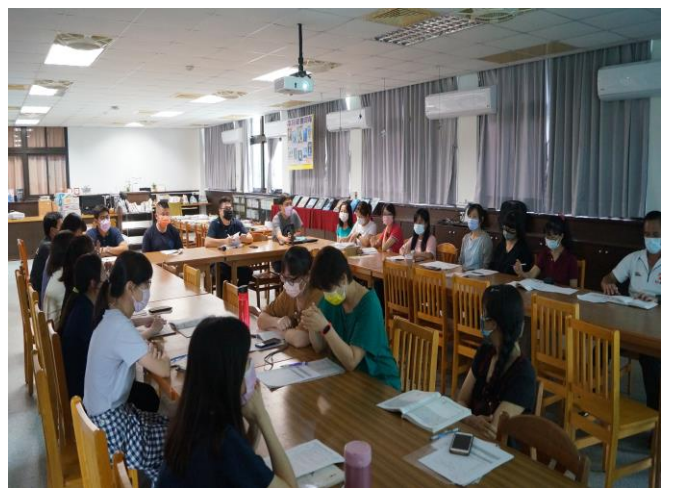
說明：定期召開委員會議追蹤與檢討愛心商店執行效益