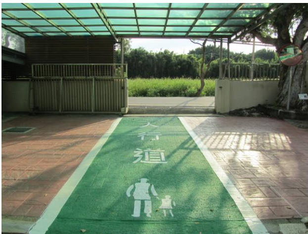
說明：學生專用步道